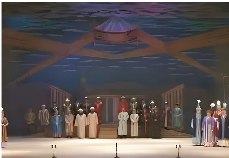
Рис. 2. Оформление сцены ко второму действию оперы «Кыз Жибек». Постановка Гафиза Есимова. КазНТОБ имени Абая. 2005. Скриншот из видеозаписи спектакля от 2 февраля 2012 года.

она в то же время актуализирует сюжет, приближая оперу к современному восприятию. Если Б. Досымжанов заложил основы для пересмотра регламентированных советских трактовок, то Г. Есимов развил эту тенденцию, создав более многогранную и исторически обоснованную сценическую версию.