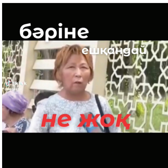
Рис. 2. Кадр из видео «Ешқандай не жоқ».

Экспозиция. Вводная часть видео содержит текст или аудиофрагмент, который погружает зрителя в контекст повествования. Обычно это цитаты или отрывки из мотивационных или философских речей, которые имеют вдохновляющий или побуждающий задуматься характер. В данном случае (см. рис. 2) этот эффект достигается за счет наложенного на видео текста, который визуально имитирует