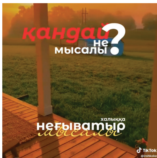
Рис. 4. Кадр из видео «Ешқандай не жоқ».

что это своего рода метамодернистская ирония, которая играет на противоречии между желанием мотивировать и осознанием бессмысленности такого мотивационного контента (Vermeulen and van den Akker 10). Использование такой эстетики проявляется через сочетание внешне искренних, «глубоких» изобразительных решений и текста, который либо не несет в себе четкого смысла, либо вступает в противоречие с визуальным рядом. Такой подход создает динамику двойственности, где зритель может воспринимать контент одновременно как шуточный и как эмоционально заряженный. Эта амбивалентность и отличает метамодернистскую логику от традиционной постмодернистской иронии, которая в большей степени ориентирована на деструкцию смыслов без попытки их переосмысления.