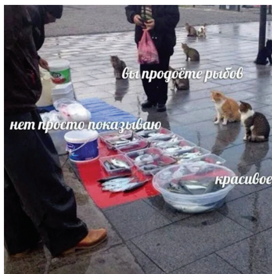
Рис. 1. Мем «Про рыбов».

В качестве методологической параллели для анализа русскоязычный мем «Про рыбов» (см. рис. 1 ), ставший вирусным в 2021 году, был подробно разобран пользователем Сашей Харитонски. Он анализирует вымышленный диалог между котятками и «НЕ-продавцом»: на вопрос «Вы продаете рыб?» следует