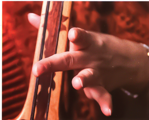
2-ші сурет. Фотоиллюстрациясы бар оқу құралындағы әдістемелік нұсқаулардың мысалы