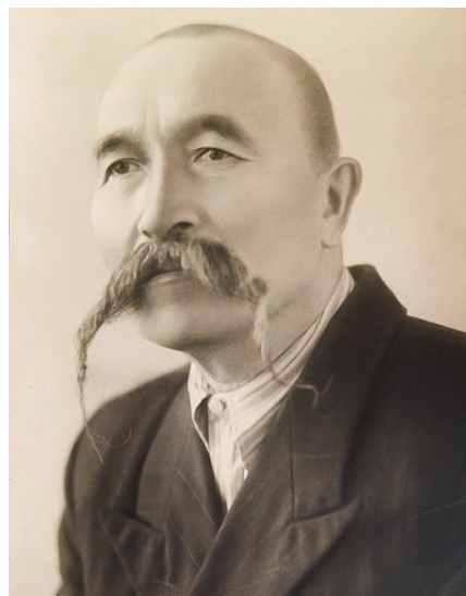
1-ші сурет. Қ. Қасымов суреті. ОМА. 1823 қор, 3 тізімдеме, 85 іс, 2 топтама.

Қазақ ұлттық аспаптар оркестрінің 3 құрылымы Ресейдегі В. Андреев орыс халық аспаптар оркестрінің үлгісі бойынша қалыптасқаны әдебиетте көрсетіледі (Жұбанов, 201; Гизатов, 12). Зерттеуші М. Имханицкий ол ұжымның балалайкашылар тобы