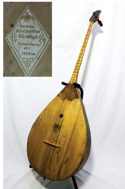
8-ші сурет. Қ. Қасымовтың Моңғолияда жасаған бас домбырасы. (Шанақтың ішінде шебердің аты жөні, қай қалада және қай жылы жасалғаны белгіленген). Алматы қаласы Ықылас Дүкенұлы атындағы музыкалық аспаптар мұражайының қоры.

Қ. Қасымовтың Моңғолияда 1959 жылы жасаған бас домбыра және қыл қобыз аспаптары қазіргі кезде Алматы қаласы Ықылас Дүкенұлы атындағы музыкалық аспаптар мұражайының қорында сақтаулы. Оларды 1992 жылы 27 сәуірінде шебер шығармашылығын сол кезде зерттей бастаған аталған музей қызметкері Зәбира Сыпатайқызы Жәкішева қабылдаған. Домбыра бас аспабы (8-ші суретті қараңыз) шебердің 1935–1957 жылдар аралығында Құрманғазы оркестріне жасаған нұсқаларына ұқсайды. Музей қорында сақталған бұл жәдігер Құрманғазы оркестрінің алғашқы кезеңдеріндегі музыкалық аспаптары тарихынан хабар береді.