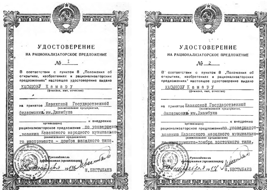
2-ші сурет. Қ. Қасымовтың рационализаторлық куәліктері. Алматы қалалық архиві. 435 қор, 26 тізімдеме, 1 іс.

Домбыра. XVIII ғасырда этнографтар назарына бастап түсе бастаған домбыра құрылымының толығырақ сипаты, оның ішінде аймақтық түрлері мен музыка ерекшеліктері туралы құнды деректер XX ғасырда А. Жұбанов, Б. Сарыбаев, Б. Ғизатов, Б. Аманов, Ә. Мұхамбетова, Ж. Нәжмеденов және т. б. ғалымдар еңбектерінде көрсетіліп, XXI ғасырдағы зерттелуі С. Өтеғалиеваның заманауи әдістемеге сүйеніп жазылған еңбектерінде жалғасқаны белгілі.