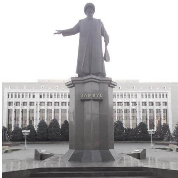
3 сурет. Жамбыл Жабаев ескерткіші

Жамбыл Жабаев қазақтың дәстүрлі ұзын етек шапан мен тымақ, сол қолында домбырасы бар, оң қолы шетке бағытталған кейпінде бейнеленген. Алғашында ақынның мүсіні қызғылт гранит тақталармен қапталған биік төртбұрышты гранит тұғырда тұрған еді. Содан кейін қала әкімдігі Жамбыл Жабаевтың ескерткішін жаңартып, көшіру туралы шешім қабылдады. Оның қазіргі орналасқан жері – Жамбыл облысы әкімдігінің алдындағы алаң. Яғни, 2018 жылдың қазан айында ауыстырылды. Орны ауысқанынан бөлек тұғыры өзгертілді. Ескерткіштегі «Жамбыл» деген жазу латын тілінде жазылды.