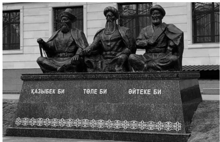
1 сурет. Үш би ескерткіші 1

Ескерткіш жайлы сөз қозғайтын болсақ сәтсіз сомдалған десек болады. Салыстырмалы түрде алып қарасақ Атырау мен Нұр-сұлтандағы үш биге арналған ескерткіштерге қарағанда төмен деңгейде сомдалған. Себебі, бет әлпетінде, шапанның қыртыстарында ағаттық жіберген және саусақтары анатомиялық тұрғыда бұрыс, яғни «өтірік» сомдалған. Комиссия мүшелері бұл ескерткішегі бұрыс шыққан тұстарын қалай байқамады? Көре тұра неге қабылдады екен? Және де тағы бір өрескел қателік деп темір қоршаудың арғы жағында орналасқанын айтуға болады. Неге бұлай орналысқаны түсініксіз. Ескерткіш халыққа ортақ және тамашалауға қолжетімді болуы керек. Ал ескерткіш бұл талаптарға сай келмейді.