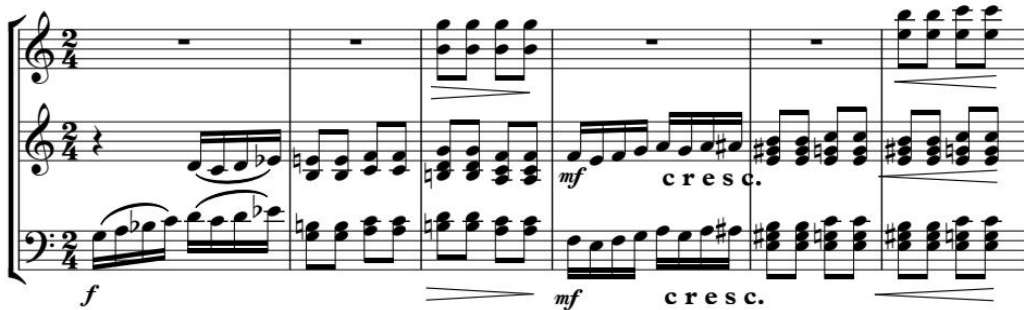
5-сурет. 54-59 т.т. -2,3 сырнайлар партиясы

Даму үдерісі музыка қозғалысын оркестр топтарының көбісі қосылып, ff динамикасында орындайтын күй тақырыбының қорытынды өтіліміне әкеледі. Шартты түрде бұл бөлімді реприза деп белгілеуге болады (60-103 т.т.). Оның бірінші бөлімнен айырмашылығы – тақырыптың негізгі тональдікте емес, оған функционалды жүйе бойынша доминанталық қатынастағы үндестіктен басталуында.